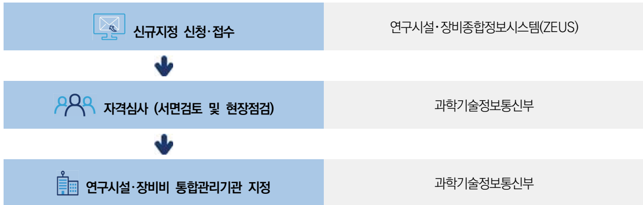
[그림 1] 연구시설·장비비 통합관리제 지정절차