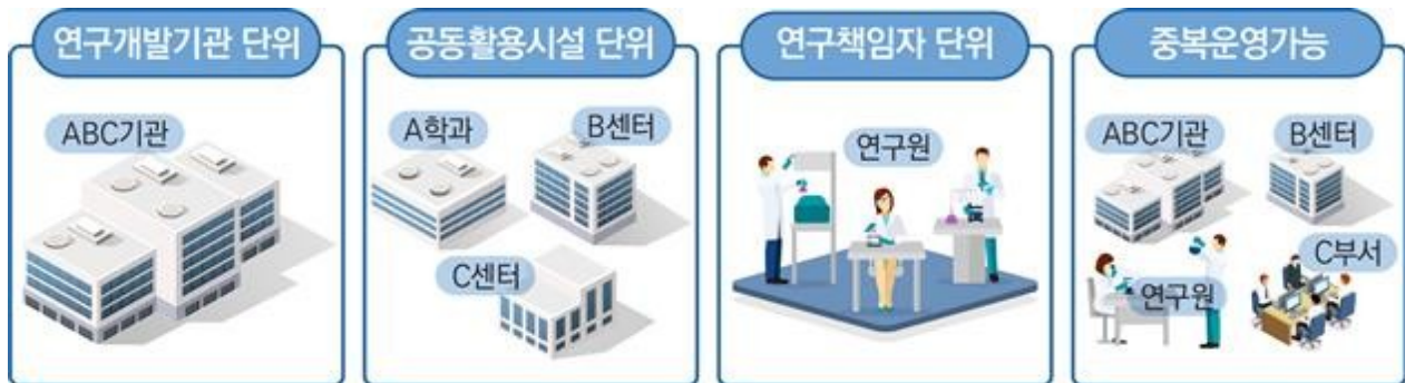
[그림 2] 가능한 연구시설·장비비 통합관리 단위